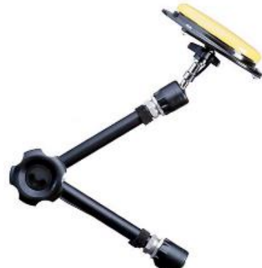
Figura 1 braccio di fissaggio

La centralina di ricezione della chiamata è comprensiva di segnalatore acustico e pulsante di presa in carico da parte dell'assistente per disattivare l'allarme, linea di ripetizione del contatto verso l'impianto di gestione delle chiamate preesistente, completo di alimentatore.