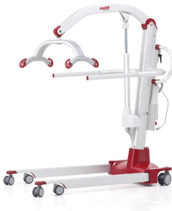
Molift Mover 300 con braccio di supporto

Molift Mover 300 ha una capacità di sollevamento di 300 kg. È la soluzione ideale per ospedali e strutture di assistenza con pazienti bariatrici che hanno esigenze di trasferimenti frequenti e quotidiani. Con il suo peso ridotto e la sua ampia capacità di portata, è uno dei più leggeri della sua categoria.